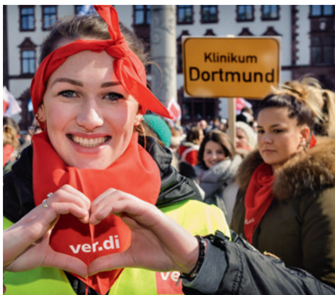
Dortmund zeigt Herz – aber mit unseren Forderungen bleiben wir hart!