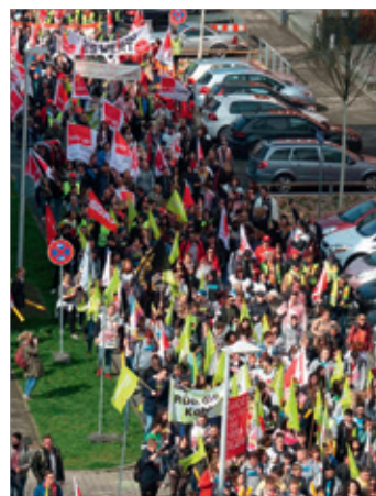
Am 11.4.18 war in Darmstadt großer Aktionstag.