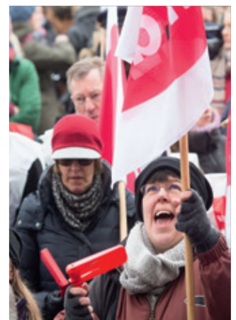
Hunderte Beschäftigte gingen in Hamburg auf die Straße.