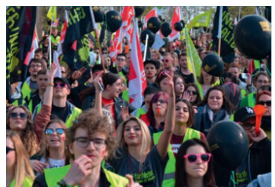
In Nürnberg gingen am 11.4.18 rund 2000 Beschäftigte auf die Straßen, darunter viele aus der ver.di Jugend.