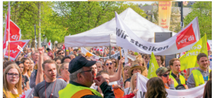
In Stuttgart streikten am 12.4.18 6.500 Beschäftigte bei frühlingshaften Temperaturen.

Nach Abschluss der Tarifrunde 2018 werden auf Spitzenebene Tarifverhandlungen zu den Regelungen bei Leistungsminimierung aufgenommen. In diese Verhandlungen werden auch Regelungen für den Bereich der Bundeswehrfeuerwehren einbezogen.