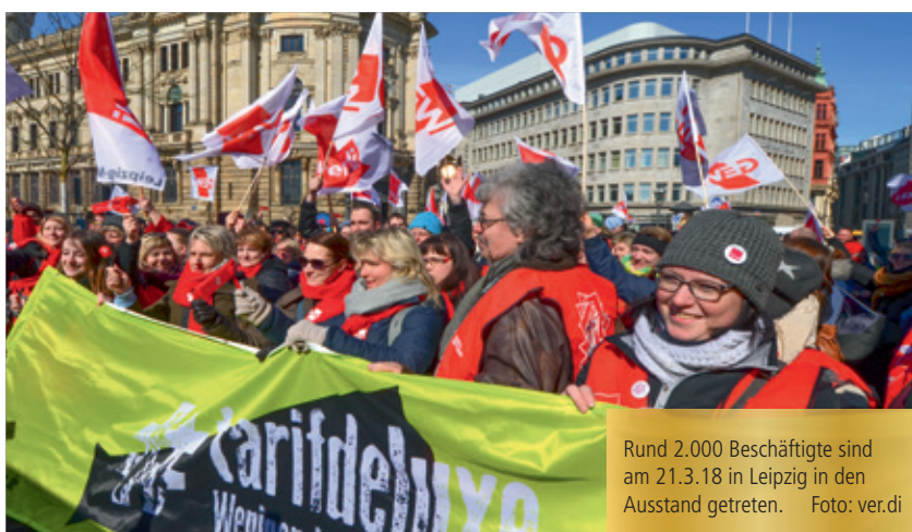
Rund 2.000 Beschäftigte sind am 21.3.18 in Leipzig in den Ausstand getreten.