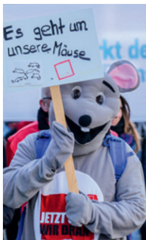
Insgesamt 3.000 Beschäftigte waren in Kiel mobilisiert und zogen vom Gewerkschaftshaus zum Rathaus.