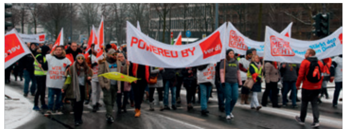
Rund 1.000 Beschäftigte demonstrierten am 20.3.18 in Wuppertal.