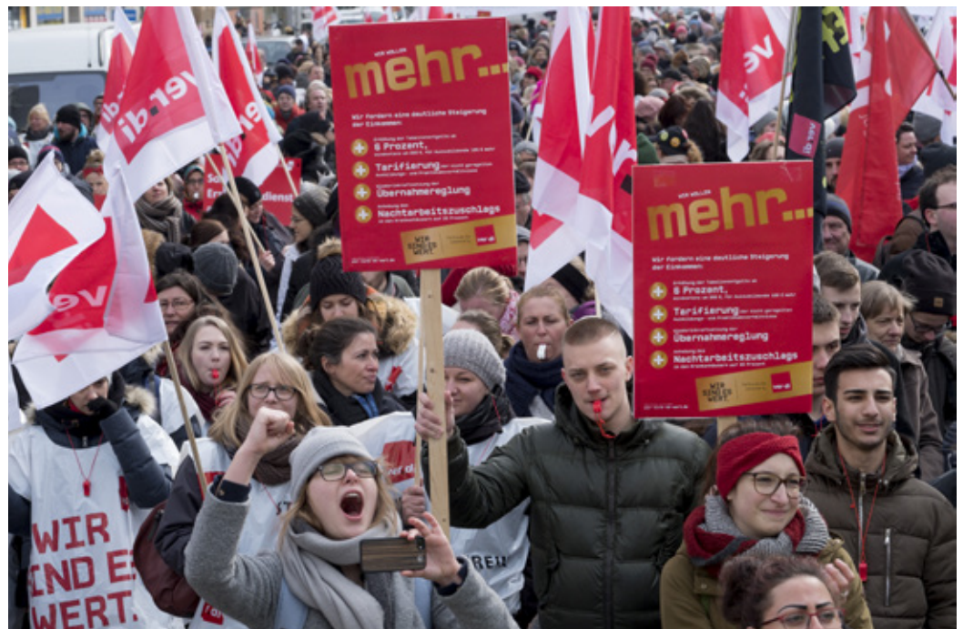
Am 22.3.18 legten mehr als 3.000 Beschäftigte des öffentlichen Dienstes in München ihre Arbeit nieder.